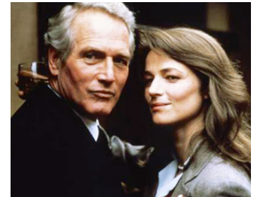
1982 LE VERDICT (The Verdict) de Sidney Lumet avec Paul Newman