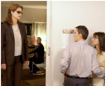
2005 LEMMING de Dominik Moll avec Laurent Lucas, André Dussollier, Charlotte Gainsbourg