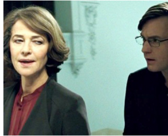
2008 MANIPULATION (Deception) de Marcel Langenegger avec Ewan McGregor