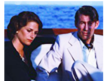
1976 FOXTROT (Foxtrot) d'Arturo Ripstein avec Peter O'Toole