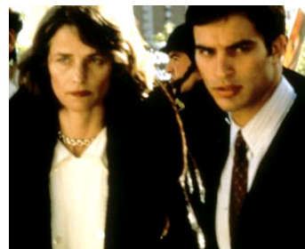
1996 PIÈGE INTIME (Invasion of Privacy) d'Anthony Hickox avec Johnathon Spaech