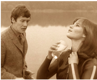
1964 LE KNACK ET COMMENT L'AVOIR (The Knack and how to get it) de R. Lester avec M. Crawford