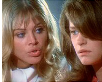
1972 ASYLUM (Asylum) de Roy Ward Baker avec Britt Ekland