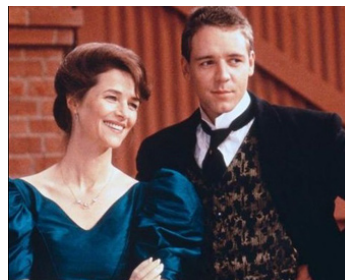
1993 HAMMERS OVER THE ANVIL d'Ann Turner avec Russell Crowe