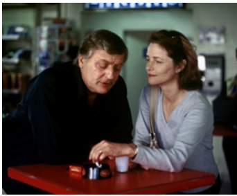
2000 SOUS LE SABLE de François Ozon avec Bruno Crémier