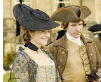
2008 THE DUCHESS (The Duchess) de Saul Dibb avec Ralph Fiennes