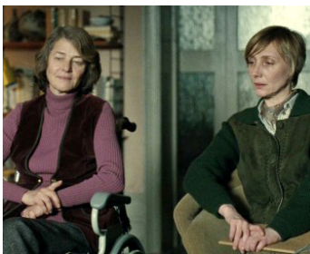
2010 NEVER LET ME GO (Never let me go) de Mark Romanek avec Nathalie Richard