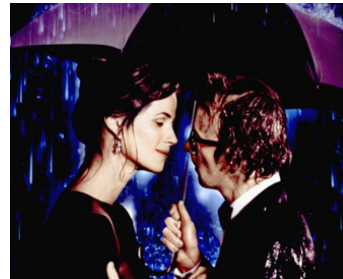
1980 STARDUST MEMORIES (Stardust Memories) de et avec Woody Allen