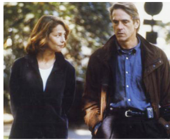
2001 VENGEANCE SECRÈTE (The Fourth Angel) de John Irvin avec Jeremy Irons