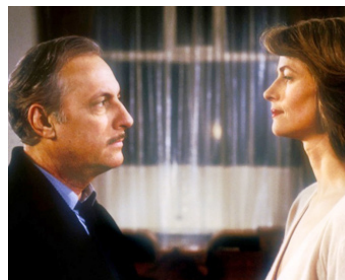
1985 ON NE MEURT QUE DEUX FOIS de Jacques Deray avec Michel Serrault