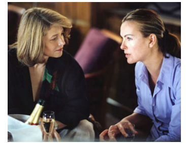
2002 EMBRASSEZ QUI VOUS VOULEZ de Michel Blanc avec Carole Bouquet