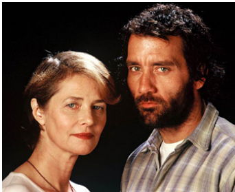
2003 SEULE LA MORT PEUT L'ARRÊTER (Ill' sleep when I dead) de Mike Hodges avec Clive Owen