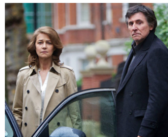
2011 MOI, ANNA (I, Anna) de Barbary Southcombe avec Gabriel Byrne