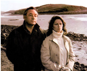
1977 UN TAXI MAUVE d'Yves Boisset avec Philippe Noiret