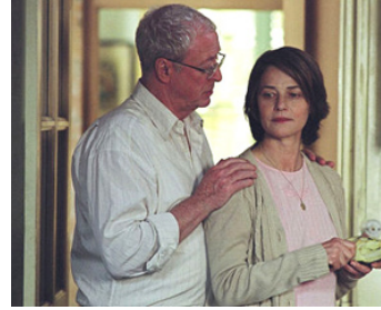
2003 CRIMES CONTRE L'HUMANITÉ (The Statement) de Norman Jewison avec Michael Caine