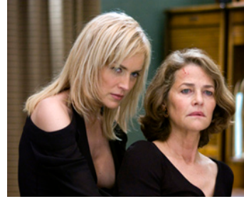
2006 BASIC INSTINCT 2 (Basic Instinct 2) de Michael Caton-Jones avec Sharon Stone