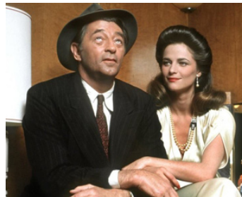
1975 ADIEU MA JOLIE (Farewell my Lovely) de Dick Richards avec Robert Mitchum