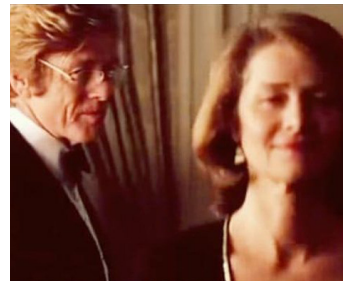
2001 SPY GAME, JEU D'ESPIONS (Spy Game) de Tony Scott avec Robert Redford