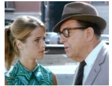
1969 ISTANBUL, MISSION IMPOSSIBLE (Target Harry) de Roger Corman avec Victor Buono