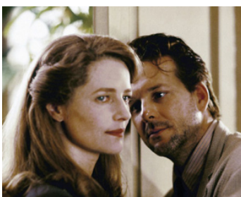
1987 ANGEL HEART, AUX PORTES DE L'ENFER (Angel Heart) d'Alan Parker avec Mickey Rourke