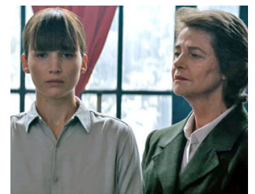
2018 RED SPARROW (Red Sparrow) de Francis Lawrence avec Jennifer Lawrence