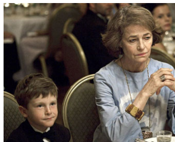
2011 MELANCHOLIA (Melancholia) de Lars von Trier avec Cameron Spurr