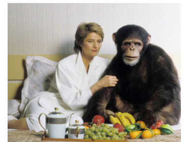
1986 MAX MON AMOUR (Max my Love) de Nagisa Oshima