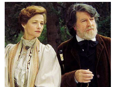
1999 LA CERISAIE (The Cherry Orchard) de Michael Cacoyannis avec Alan Bates