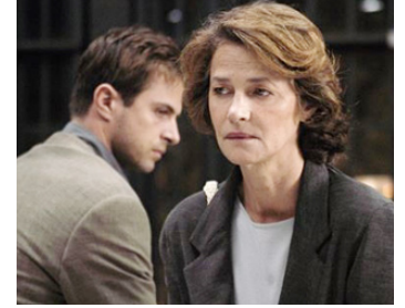
2004 LES CLEFS DE LA MAISON (Le Chiavi di Casa) de Gianni Amelio avec Kim Rossi-Stuart