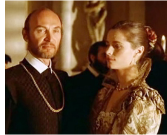
1973 GIORDANO BRUNO (Giordano Bruno) de Giuliano Montaldo avec Vernon Dobtcheff