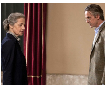
2013 UN TRAIN DE NUIT POUR LISBONNE (Night Train to Lisbon) de Bille August avec Jeremy Irons