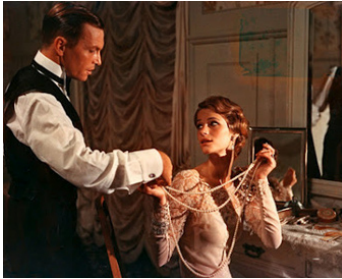
1969 LES DAMNÉS (La Caduta degli Dei) de Luchino Visconti avec Helmut Griem