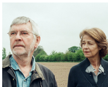
2015 45 ANS (45 Years) d'Andrew Haigh avec Tom Courtenay