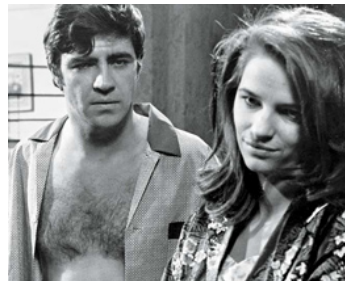
1966 GEORGY GIRL (Georgy Girl) de Silvio Narizzano avec Alan Bates