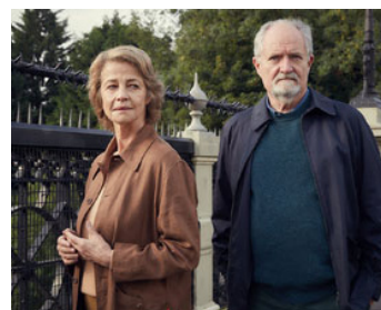
2017 À L'HEURE DES SOUVENIRS (The Sense of an Ending) de Ritesh Batra avec Jim Broadbent