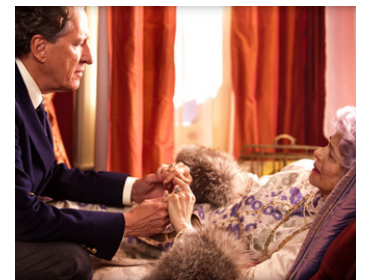
2013 L'ŒIL DU CYCLONE (The Eye of the Storm) de Fred Schepisi avec Geoffrey Rush