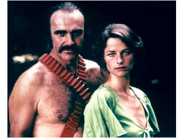
1974 ZARDOZ (Zardoz) de John Boorman avec Sean Connery