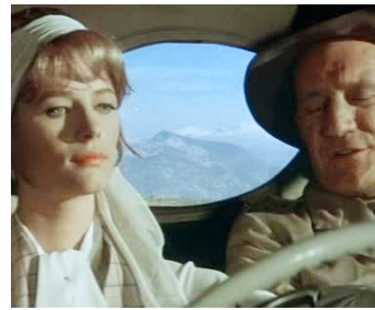
1967 LES TURBANS ROUGES (The long Duel) de Ken Annakin avec Trevor Howard