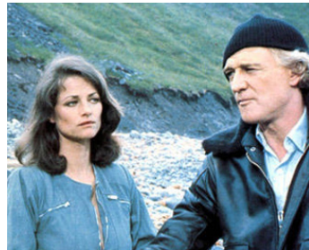
1977 ORCA (Orca) de Michael Anderson avec Richard Harris